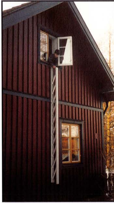
2. Stegen faller ut av sig själv...