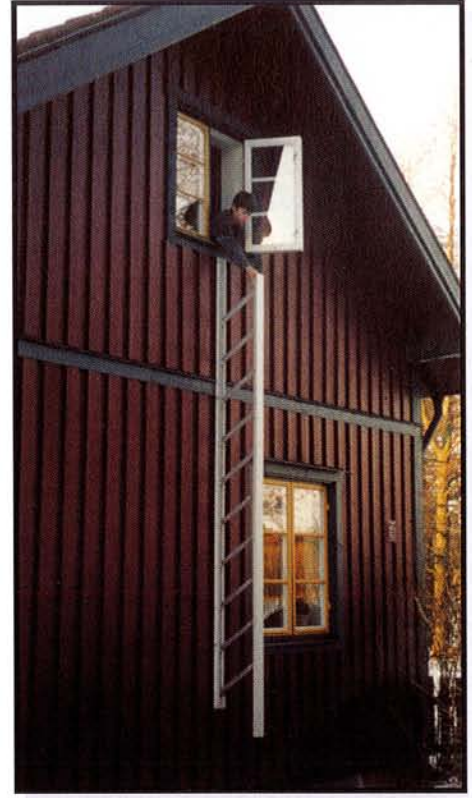
3. Sedan är stegen klar att användas.