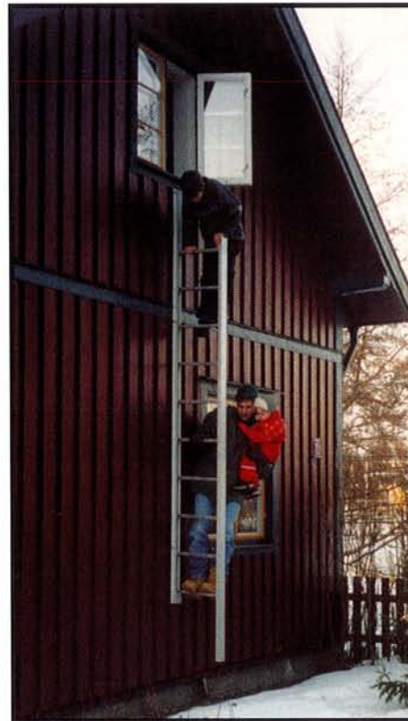
5. Klättra hela vägen ned på samma sida om stegen och håll stadigt i stegpinnarna eller den yttre profilen. Hela denna operation tar endast några få sekunder.