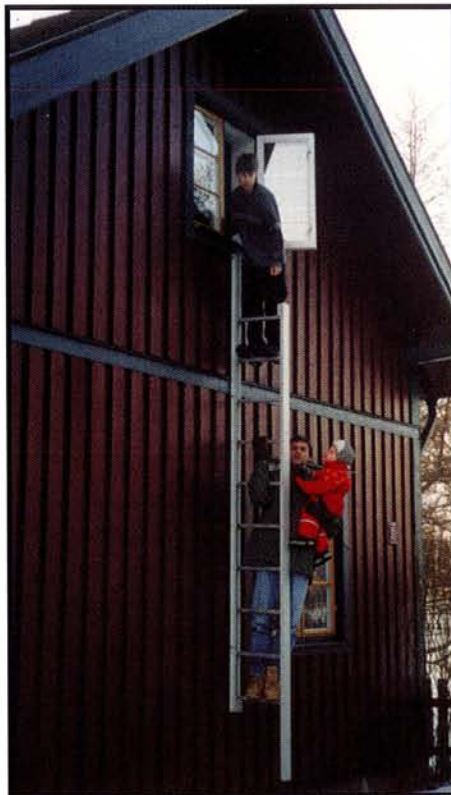
4. Tag ett stadigt tag i fönsterkarmen - eller brädan med ena handen och sätt en fot på lämpligt steg. Påbörja nedklättringen. Stegen bär en mycket stor last varför det går bra att vara fler personer i stegen samtidigt.