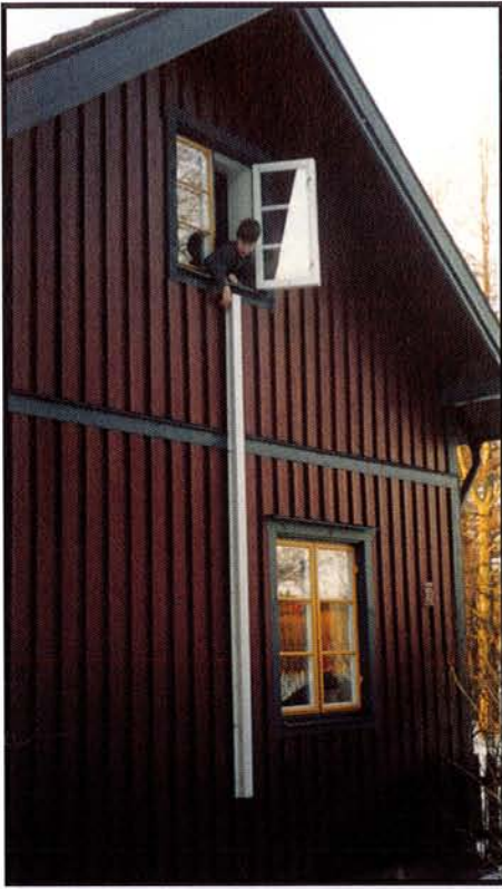
1. Öppna fönstret och drag ur sprinten som låser stegen